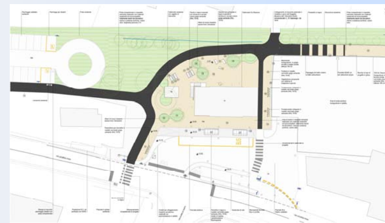
Progetto riqualficazione area ex stazione