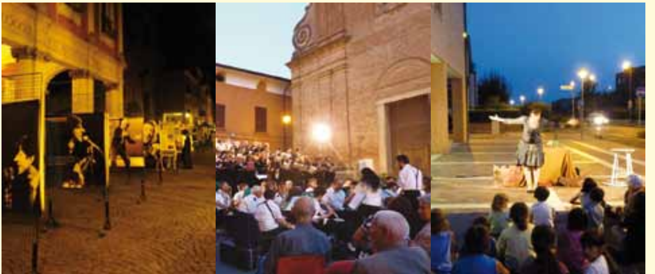
Appuntamenti che hanno animato piazze e strade medicinesi: "Medicina al Centro di venerdì" (7/14/21 giugno) Mostra "Qualcuno era ... Giorgio Gaber"; omaggio a Verdi; "La Corte in festa" (9/16/19/24/26 luglio) (sopra) "La notte si tinge di colori" a Villa Fontana (29 giugno); Serate Gentlemen Loser all'area Pasi (11/18/25 luglio) (sotto)