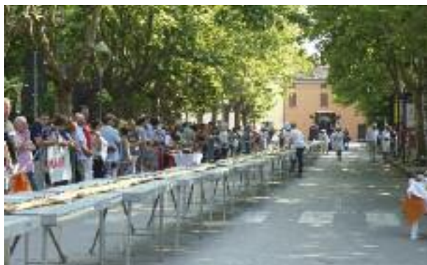
Medicipolla 2013: frittata da guinness

L'Amministrazione in questi anni ha supportato la promozione e la valorizzazione dei prodotti tipici di Medicina , attraverso una pluralità d'iniziative e manifestazioni, ad esempio Medicipolla , in collaborazione col Consorzio della Cipolla e la Pro Loco. In particolare nel 2013 è stata messa a bando un'area per la realizzazione di una nuova pesa pubblica a servizio degli agricoltori medicinesi che verrà inaugurata entro aprile 2014.