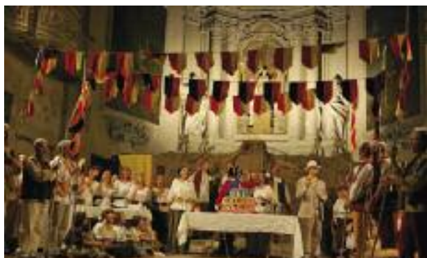
L'Elisir d'Amore alla Chiesa del Carmine

Specie durante l'estate si è puntato a valorizzare il centro storico, piazza Argentesi e l'Area Pasi , con manifestazioni organizzate con i commercianti e le associazioni attive in quegli spazi. Grazie anche alla collaborazione con Pro Loco è nata Medicina al centro di venerdì , che lo scorso giugno ha portato centinaia di persone in centro, con l'apertura straordinaria dei negozi. Nel mese di aprile potremmo finalmente riaprire la Chiesa del Carmine, dopo importanti lavori per la messa in sicurezza di questo luogo, che ricopre un ruolo fondamentale per la valorizzazione del nostro centro storico.