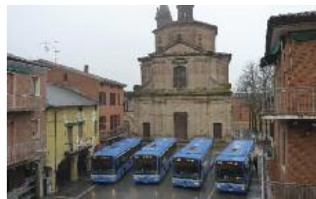
Greenbus a Medicina

Al fine di favorire l' intermodalità gomma/ferro , i Comuni del Circondario hanno deciso d'investire circa 470 mila euro, per la metà fondi regionali ed europei, nel raddoppio del parcheggio nord della stazione ferroviaria di Castel San Pietro. L'opera, che verrà realizzata entro il 2014, permetterà l'accesso dei mezzi pubblici, anche in vista di un prossimo collegamento diretto Medicina-CSP stazione.