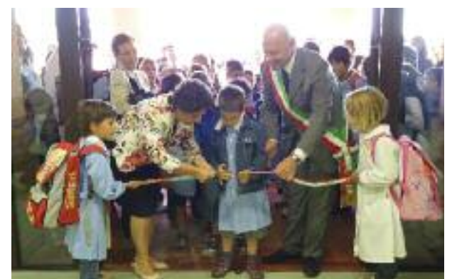
Scuola "E. Biagi" di Villa Fontana

L'impegno a sostenere le famiglie, attraverso forti scelte di bilancio , in questi anni ha trovato attuazione anche attraverso numerosi bandi di carattere straordinario. Solo nel 2013, grazie al coordinamento con i Servizi sociali locali, sono stati erogati circa 130 mila € , a favore di oltre 150 famiglie medicinesi. Un percorso che contemporaneamente ha visto un forte aumento dei controlli sulla morosità e sulla veridicità delle dichiarazioni presentate, per intercettare nuovi disagi e concordare rientri sostenibili.