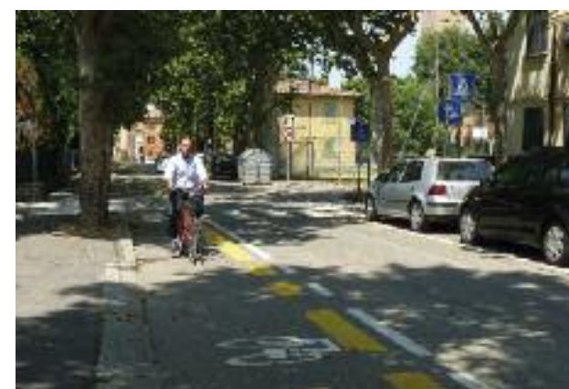
Pista ciclabile di Via Battisti

Dal 2012 abbiamo avviato un censimento degli immobili con coperture contenenti amianto. Nel 2013 è stato sottoscritto un protocollo tra Azienda Usl di Imola e Comune per strutturare al meglio le attività di censimento, controllo e rimozione di manufatti contenenti amianto nel territorio comunale. Sottoscritto inoltre il protocollo operativo tra il Comune di Medicina, l'Ausl, Hera, Arpa per l'approvazione della procedura relativa alla rimozione controllata di ridotte quantità di cemento amianto da parte di privati cittadini nelle proprie abitazioni e successivo smaltimento.