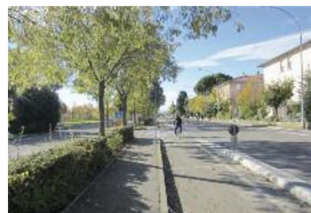
Ciclabile di via Argentesi

Riguardo alla viabilità ci si è adoperati per ottenere una netta separazione del traffico passante, specie pesante, da quello locale. Il traffico è stato indirizzato sulla Traversale di Pianura, vietando ai camion l'attraversamento del capoluogo (via Fava) e di Ganzanigo. Tale tratto sarà inoltre oggetto di riqualificazione grazie alla realizzazione della nuova bus station, presso la ex stazione e della nuova rotonda (via Fava-Marconi-Canale) che vedrà l'inizio lavori subito dopo l'estate, grazie al cofinanziamento regionale di 240 mila euro. Lungo tutto il 2013 è stato realizzato il piano della viabilità veicolare e ciclopeditone del capoluogo e d'alcuni altri specifici contesti frazionali e sono stati realizzati nuovi percorsi ciclabili e ciclopeditoni per oltre 2000 metri lineari come sollecitato da tanti cittadini.