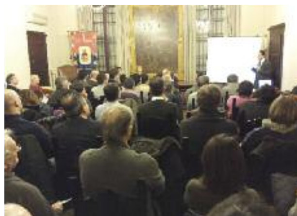
Il PAES: un percorso partecipato

Subito a inizio mandato l'Amministrazione comunale ha aderito al Progetto SIGE (Sistema Integrato di Gestione dell'Energia) insieme a Casalecchio, Sasso Marconi, San Lazzaro, Ozzano e Mordano. Questo ci ha portato negli anni al conseguimento di una serie di azioni: 1) L'adozione di un Piano Energetico Comunale (PEC) finalizzato a uno studio dei consumi energetici del nostro territorio. 2) Realizzazione di una grande piattaforma fotovoltaica sulla nuova scuola elementare di Villa Fontana. 3) Attivazione d' azioni per il risparmio energetico attraverso una gestione integrata dell'energia e l'installazione di pannelli fotovoltaici su ulteriori 15 immobili comunali. 4) Avvio della Comunità Solare Locale , un modello d'aggregazione collettiva che dà l'opportunità ai cittadini di poter aderire al risparmio energetico acquisendo una quota di fotovoltaico messo a disposizione dal Comune oltre ad altre forme d'incentivi economici. 5) La costruzione del PAES, Piano d'Azione per l'Energia Sostenibile , uno strumento in cui confluiranno le indicazioni pratiche giunte dai cittadini che consentirà di programmare e realizzare interventi specifici sulle tematiche energetiche e ambientali a favore della collettività e in grado di stimolare l'economia verde locale.