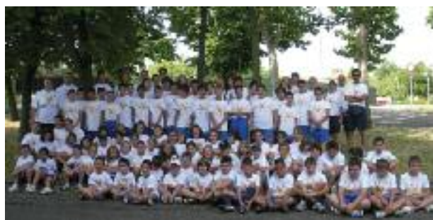
Campo estivo realizzato dalle società sportive

Le convenzioni con le società sportive sono passate da annuali a pluriennali, permettendo una migliore programmazione delle attività, specie per quelle realtà impegnate nell'educazione sportiva di bambini e ragazzi. Con la nuova palestra di Villa Fontana e la costruzione del terzo campo da tennis è proseguito il miglioramento e l'ampliamento delle strutture sportive comunali .