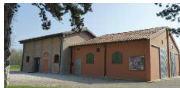
Cascina Pasi dopo gli interventi di recupero

Il recupero di Cascina Pasi , nuovo foyer del Magazzino Verde e Sala prove della Banda municipale, ha completato la realizzazione di quello che possiamo definire un piccolo polo culturale e d'incontro dedicato ai più giovani. Villa Pasi , infatti, già ospita da tempo le Associazioni Medardo Mascagni e Enrico Larry Buttazzi , le cui scuole di musica sono ormai punti di riferimento per i giovani medicesi, assieme a quella della Banda. Inoltre, presso Villa Pasi sono attivi il Centro giovanile e la Sala Prove gestita dal circolo Arci Gentlemen Loser , che prosegue con successo anche nell'organizzazione del Medicina rock festival e di altre iniziative musicali estive presso l'Area Pasi.