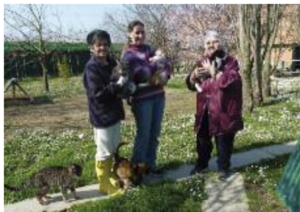
Oasi felina "Felix" di Medicina

presso l' oasi felina comunale , attraverso l'allestimento in loco di un ambulatorio in accordo con l'Ausl veterinaria imolese.