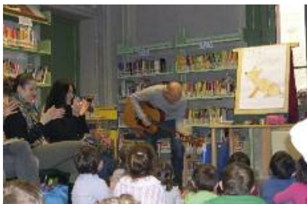
Biblioteca comunale "Nati per la Musica"

Sono aumentate le iniziative promosse dalla biblioteca , dal museo e dalla pinacoteca , anche grazie ai maggiori investimenti. Nel 2013 si è costituito il gruppo di lettura della Biblioteca comunale. Sulla biblioteca e sull'Auditorium comunale in questi anni sono stati realizzati numerosi investimenti che oggi li rendono maggiormente funzionali per le attività svolte.