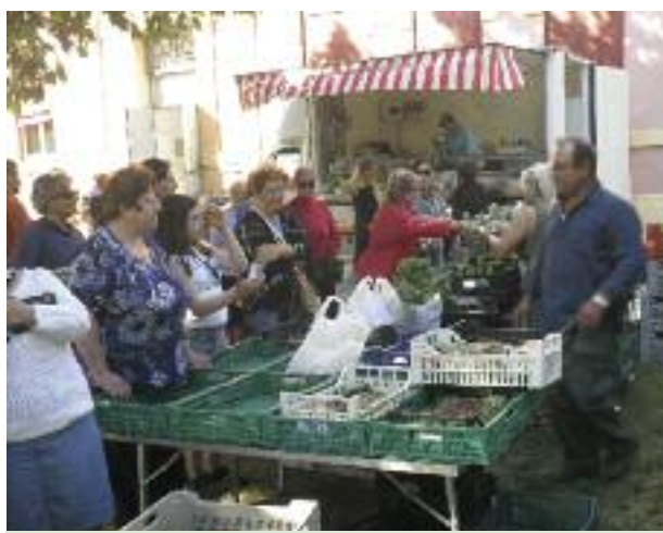
Al marchè d'la Vella

Per valorizzare i prodotti agricoli del territorio è stato istituito il mercato agricolo (Farmer Market) di Villa Fontana presso il cortile delle ex scuole elementari della frazione. Nel capoluogo, invece, in accordo con gli ambulanti è stato riorganizzato il mercato del sabato mattina presso piazza Garibaldi.