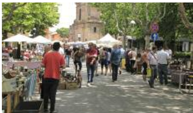
Mostra Mercato "I Portici"

Da oltre un anno stiamo lavorando con l'Anci regionale per ottenere una legge sui mercatinetti degli hobbisti che non penalizzi così pesantemente il nostro centro storico e i nostri commercianti. La mostra-scambio, che proprio in questi mesi ha compiuto 10 anni, si è attestata come una delle principali manifestazioni regionali del settore, capace di richiamare a Medicina migliaia di turisti.