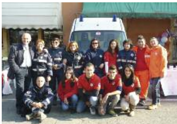
Festa del volontariato

Il volontariato rappresenta una grande e peculiare ricchezza per il nostro territorio. In alcune occasioni la forte sinergia con il volontariato locale ha permesso di mantenere presenti sul territorio servizi in fase di forte riorganizzazione a livello statale e regionale. Un grande ringraziamento va a tutti i medicesi che offrono tempo e passione per i loro concittadini.