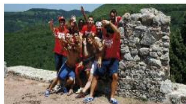
Campi estivi organizzati da Libera-Terra

Pace e legalità sono due concetti sui quali molto si è lavorato in questi anni, specie con i ragazzi delle superiori. L'associazione La Strada , oltre al progetto d'educazione alla pace, all'intercultura e alla legalità svolto nelle scuole, con i suoi educatori ha accompagnato alcuni gruppi di ragazzi nei campi estivi organizzati da "Libera-Terra" in Calabria e Sicilia, all'interno di progetti voluti e finanziati dai Comuni e dalla Regione.