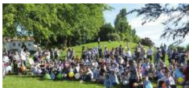
40° Anniversario Nidi Comunali - Parco Villa Pasi

Si è posta grande attenzione alla sicurezza dei nidi e delle scuole, con controlli sistematici delle situazioni strutturali e realizzando nelle strutture comunali interventi finalizzati al miglioramento della sicurezza antintrusione, antincendio e sismica . Importanti, inoltre, gli interventi attuati o in fase d'attuazione per la qualificazione tecnologica e energetica delle strutture. È stato, inoltre, ottenuto il nuovo indirizzo di "Scienze applicate" per il Liceo di Medicina e si è puntato a raccordare e valorizzare le iniziative nel campo educativo attraverso il Tavolo di Coordinamento delle realtà educative .