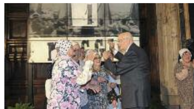
Le Mondine al Quirinale per la Festa del Lavoro

Sono state promosse e valorizzate tutte quelle iniziative impegnate a valorizzare la Memoria della Resistenza , coinvolgendo le realtà associative e le scuole. È stata rifinanziata ogni anno la visita per alcuni studenti delle superiori al campo di sterminio di Mauthausen. È stato dato supporto all'ANPI di Medicina per le varie iniziative promosse a livello comunale. È stato dato supporto alla ricerca e alla presentazione delle domande per la concessione, da parte del Presidente della Repubblica, della Medaglia d'Onore agli Internati Militari medicesi deportati al lavoro coatto.