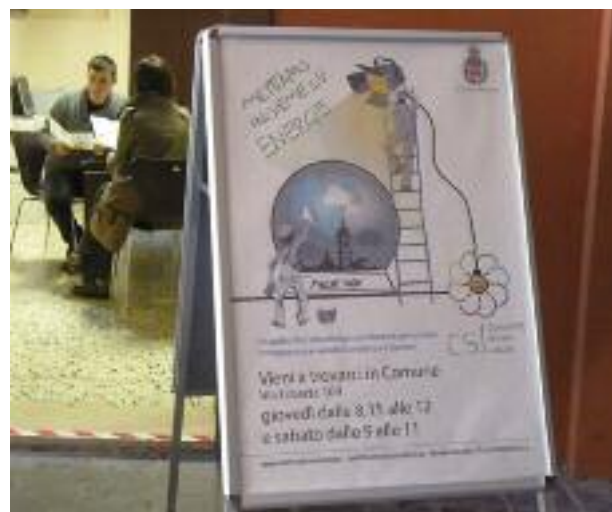
Lo Sportello della Comunità Solare in Comune

Nel 2013 il Comune ha sottoscritto una convenzione con Enel Sole per l'efficientamento e la riduzione dei consumi elettrici della pubblica illuminazione . Grazie all'accordo, il risparmio economico derivante dalle nuove tecnologie utilizzate (circa il 30% in meno) permetterà un profondo ammodernamento dell'intero sistema d'illuminazione pubblica del territorio, a partire dal centro storico, con la sostituzione di circa 1000 nuovi corpi illuminanti.