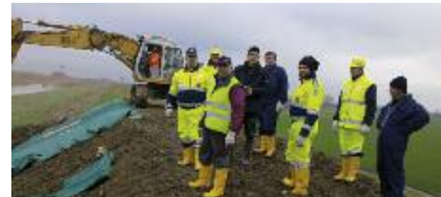
I volontari di Medicina sull'argine del Quaderna

dell'Associazione medicese di Protezione civile, collegata alla colonna mobile regionale e convenzionata con il Comune che ha ovviamente confermato il proprio supporto, economico e di mezzi. Un bel passo avanti per il gruppo e un orgoglio per il nostro territorio.