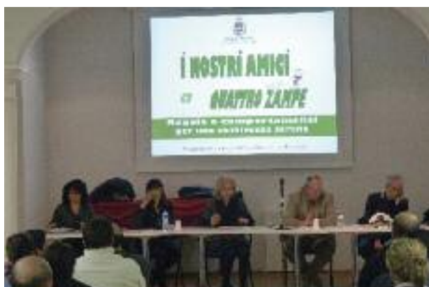
I nostri amici a quattro zampe

Sono state incrementate le ore di apertura della stazione ecologica di Medicina al fine di favorire il conferimento dei materiali differenziati da parte dei cittadini. Nel 2013 è stato introdotto il servizio di raccolta a domicilio di sfalci e potature. Nel 2014 prenderà avvio un nuovo progetto, condiviso con le Consulte Ambiente e Volontariato, finalizzato a incrementare la raccolta differenziata portandola intorno al 55%. Inoltre, entro l'estate sarà installata anche a Medicina la "casa dell'acqua" , alternativa economica ed ecologica all'acquisto di acqua in bottiglia.