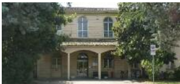
Casa della Salute

L'investimento da parte dell'Ausl di Imola di oltre 300 mila euro ha portato al completamento e all'inaugurazione della Casa della Salute . L'obiettivo, grazie agli operatori e ai medici di base, è quello di garantire continuità assistenziale per 24 ore, 7 giorni su 7. Ogni settimana circa 2800 cittadini usufruiscono dei servizi della CdS di Medicina, che serve anche Castel Guelfo e Sesto Imolese.