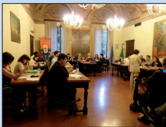
Insediamento del Consiglio comunale 16 giugno 2014

Tra le novità di questa tornata elettorale: la riduzione del numero dei Consiglieri da 20 a 16 , la riduzione del numero degli Assessori da 7 a 5 , effetto della Legge finanziaria per l'anno 2010 (L. 23/12/2009, n. 191, modificata ed integrata dal D.L. 25 gennaio 2010, n. 2). Inoltre le norme introdotte dalla Legge 215/2012 in materia di promozione della parità di uomini e donne nell'accesso alle cariche elettive regionali e comunali, hanno fatto sì che nella Giunta nessuno dei due sessi possa essere rappresentato in misura inferiore al 40 %.