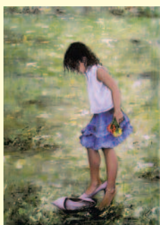
"Un percorso nell'arte"

"Senza la memoria" è la mostra fotografica di Simone Martinetto che si terrà alla Chiesa del Carmine dal 18 ottobre al 2 novembre 2014. Sabato 18 alle 18,00 alla Chiesa del Carmine si terrà l'inaugurazione e a seguire alle 19,00, presso l'Auditorium, verrà presentato il libro omonimo "Senza la memoria" scritto da Martinetto e pubblicato dall'editore Pazzini. L'esposizione rimarrà aperta tutti i giovedì dalle 10,00 alle 12,00, mentre sabato e domenica dalle 10,00 alle 12,00 e dalle 15,00 alle 18,00.