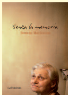
"Senza la memoria"