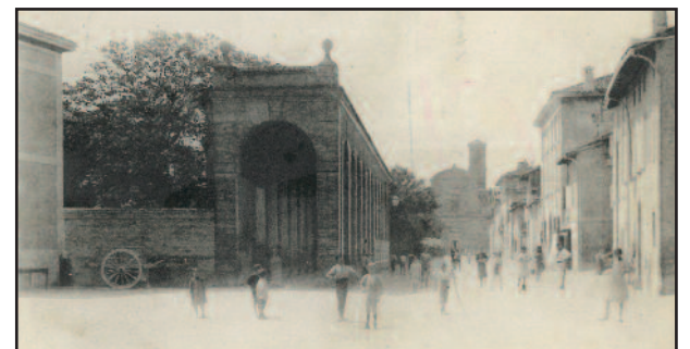
Portico "Venturoli" - Cartolina d'inizio '900

Con l'avvicinarsi della fine dell'anno, diviene naturale fare un bilancio delle attività e degli eventi organizzati e promossi dalla Pro Loco. Un bilancio positivo, reso possibile dall'impegno di tutti i volontari che hanno dedicato tempo per la Comunità. Sono tanti gli eventi organizzati: dal Carnevale, alla Festa di Primavera, alla Fiera di Luglio, oltre al Barbarossa, alla Festa d'Autunno ed ora il ricco calendario natalizio. Lo spirito della Pro Loco è quello di lavorare per il territorio e così quest'anno al Barbarossa abbiamo deciso di far gestire il servizio alle porte d'ingresso a quattro associazioni locali a fronte di un contributo, senza ricorrere ad esternalizzazioni. Un piccolo gesto, ma per noi significativo. Un grazie quindi a tutti quelli che ci hanno aiutato, all'Amministrazione comunale e a quanti hanno partecipato alle nostre iniziative. Colgo l'occasione anche per augurare a tutti buone feste.