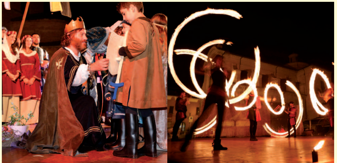
Rievocazione storica del Barbarossa - 19, 20, 21 settembre 2014 (sopra); Festa del Gemellaggio: l'arrivo del 1° Raid in tandem Romilly/Medicina - 18 settembre 2014 (sotto a sinistra); Festa d'Autunno - 26 ottobre 2014 (sotto a destra).