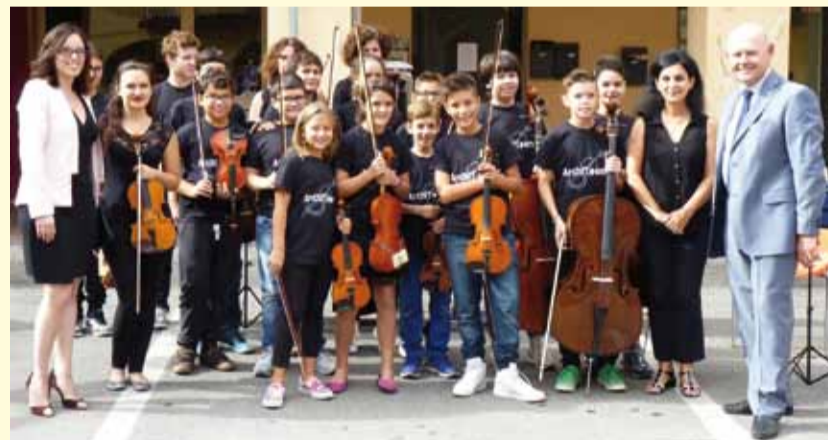
"Barbarossa" - 16/18 settembre (foto sotto); Concerto d'archi con "Archi Team" - 18 settembre (sopra); "Festa d'autunno" - 23 ottobre (a destra)